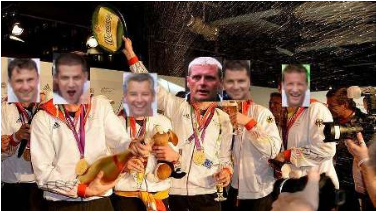
Diejenigen die untrainiert Medaillen einfahren werden, üben die Feierei auch schon mal im großen Stil!